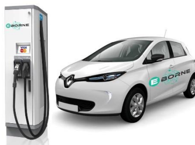
Création de borne électrique

Mission : Prestation d'AMOA et création d'un conceptuel pour la création de nouveaux services connectés à destination des résidents de 2025